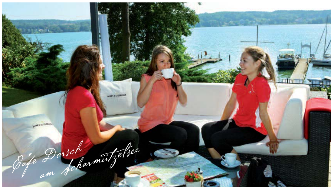
Café Dorsch am Scharmützelsee