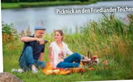
Picknick an den Friedländer Teichen