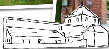
Eingang Burg Friedland